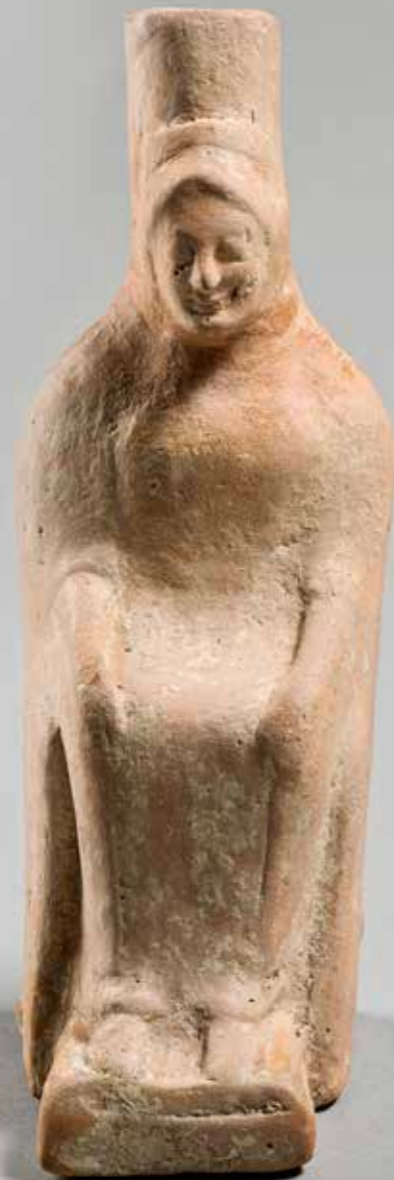
Figurine en terre cuite de femme trônant, vers 500 av. J.-C., production tarentine, découverte à Canosa. Paris, musée du Louvre, inv. MNB 2018 (achat G. Lafaye à Naples, don de l'EFR au Louvre en 1880)

supplémentaire à l'histoire de l'archéologie des Pouilles au lendemain de l'unification italienne 29 . Un peu plus d'un siècle après leur entrée dans la collection, l'École française de Rome jouera un rôle de premier plan dans l'histoire archéologique du site 30 .