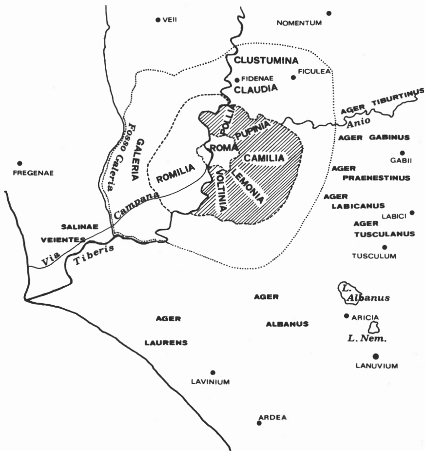
CARTE I – LES TRIBUS RUSTIQUES ET L'«AGER ROMANUS» DU VI e AU V e S. SELON A. ALFÖLDI, «EARLY ROME», P. 296 sq. (Chap. II, p. 49 sq.)

1) Le cercle le plus restreint (en tirets ---) donne les frontières de l'ager Romanus anti- quus . La portion hachurée figure, selon A. Alföldi, les limites des tribus rustiques à l'époque des XII T. La circonférence n'aurait été achevée qu'après le milieu du V e s.