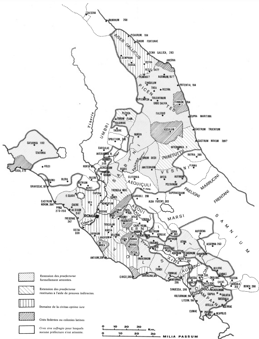
CARTE V - LA DIFFUSION DES «PRAEFECTURAE» COMPARÉE À L'EXTENSION DE LA «CIVITAS SINE SUFRAGIO» (cf. Chap. IX).